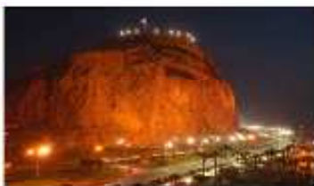
Faldeos del Morro (Museo In Situ)