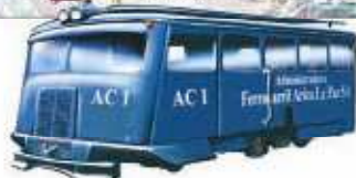
Autocaril Billard 12 pasajeros

Generación del proyecto de Construcción y habilitación de un Hotel – Escuela en Putre , cuyo concepto estará basado en altos estándares internacionales de calidad en infraestructura, equipamiento y servicios , con el propósito de transformar este territorio en un importante centro estratégico y de especialización , orientado a satisfacer la creciente demanda de turistas de larga distancia, que recorren principalmente el circuito andino (Chile - Bolivia - Perú).