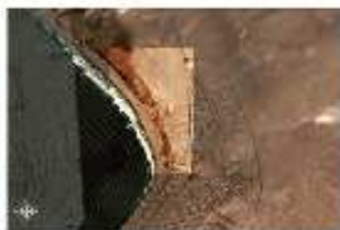
Playas Chinchorro - Las Machas

Diseñar el proyecto que posibilite la construcción y habilitación de un museo monumental, interactivo, tecnológico, diferenciador , y de nivel internacional , que exhiba los vestigios de la Cultura Chinchorro y de épocas precolombinas existentes en las provincias de Arica y Parinacota.