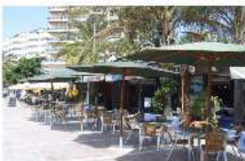
Restaurantes y Cafeterías