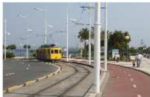
Luminarias, Ciclovías y Tranvía

Obras de infraestructura que conectan a la ciudad de Arica con el Mar.