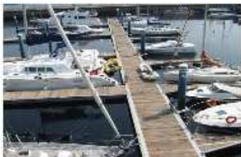
Puertos Deportivos & Marinas