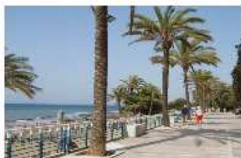
Paseo Peatonal Costero