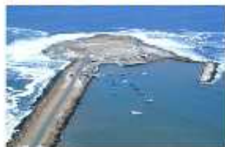
Ex Isla El Alacrán