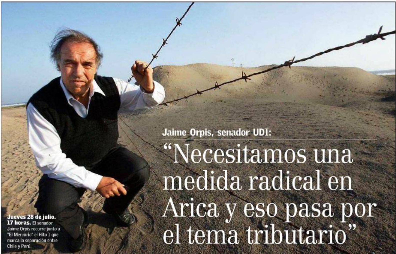
Jueves 28 de julio. 17 horas. El senador Jaime Orpis recorre junto a "El Mercurio" el Hito 1 que marca la separación entre Chile y Perú.